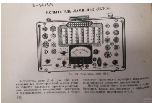
ИЛ-14. Рабочий. С картами. Есть книга со схемой.